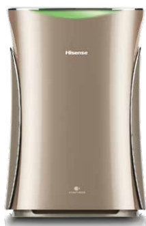
Очистители с функцией увлажнения ECOLife Champagne Brilliant